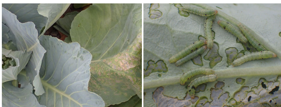
写真3 ハスモンヨトウによるキャベツ被害葉