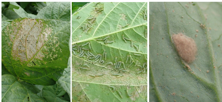
写真1 ハスモンヨトウ (左: 白変葉、中: 若齢幼虫、右: 卵塊 ※白変葉: 初期被害葉)