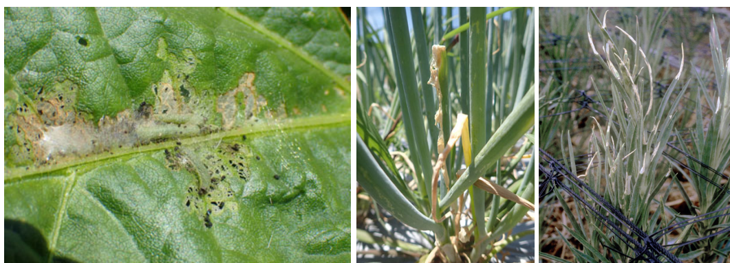
写真4 シロイチモジヨトウによる被害葉